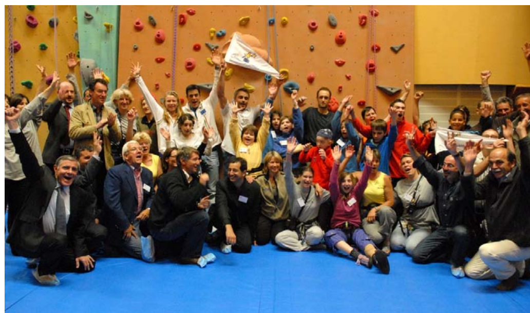
Une fière équipe !